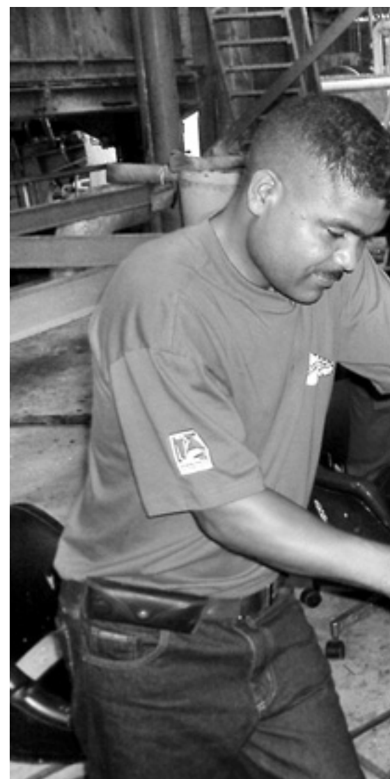
När pappfabriken Invepals ägare försökte ansluta

Vad händer då om en sådan åtgärd diskuteras på stormötet, men kommer i konflikt