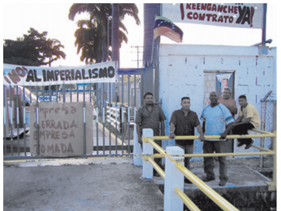
”Företaget stängt – företaget ockuperat” står det på ett plakat vid ingången till Oxidor.

På lokal nivå sjuder det av konflikter på den venezolanska arbetsmarknaden. En bedömning utifrån medierapporter visar på att antalet strejker, demonstrationer och ockupationer är åtminstone på samma nivå som i Argentina månaderna efter det ekonomiska sammanbrottet 2001. Offentliganställda på verksamheter som utbildningsministeriet, återvinningsstationerna i Caracas, Complejo Refinador Paranagua, och i kom-