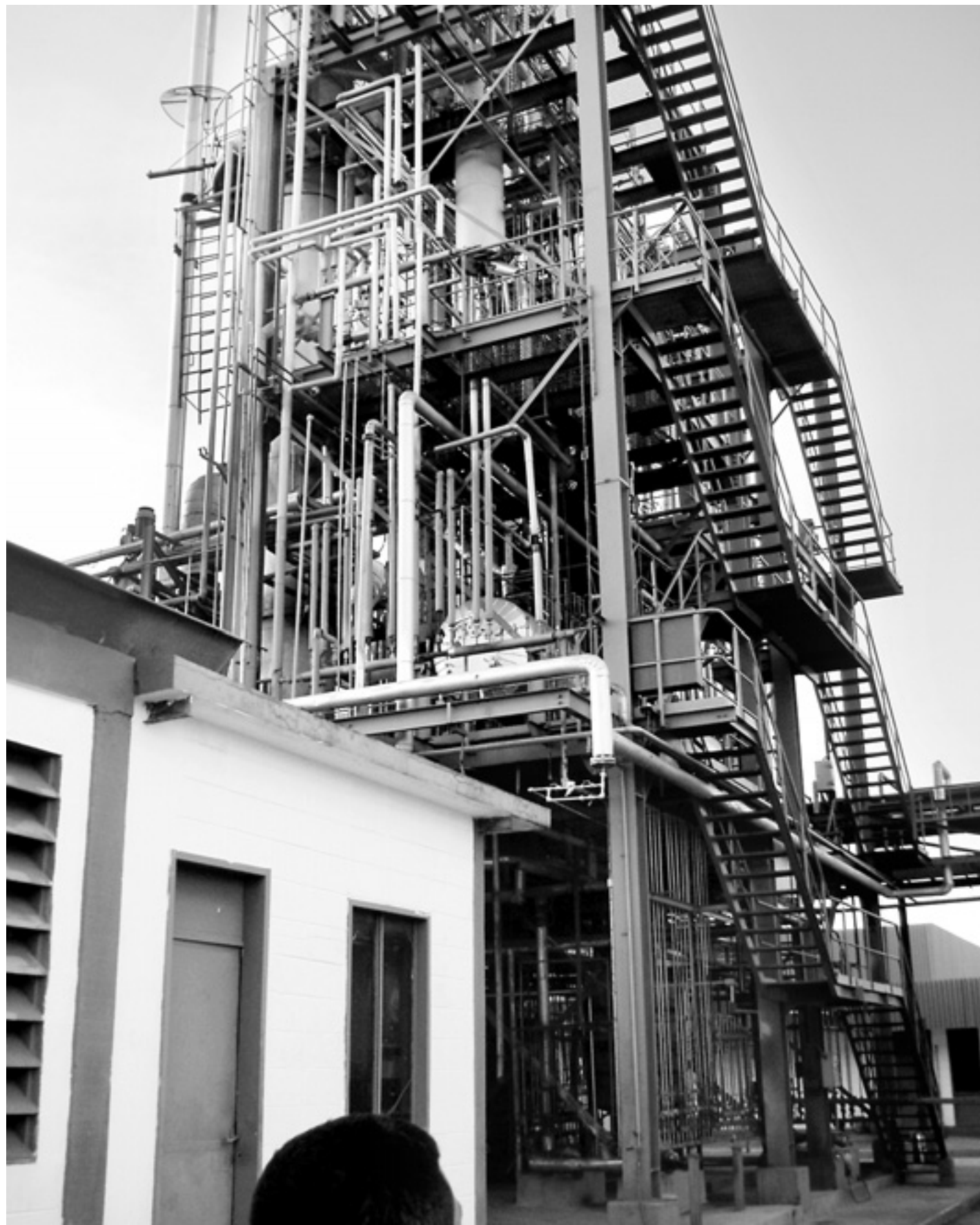
I tornet destilleras föroreningar bort från ftalatet i Oxidors produktion. Men nu står allt stilla i den ockuperade fabriken.

Rowan förklarar att kooperativet inte vill