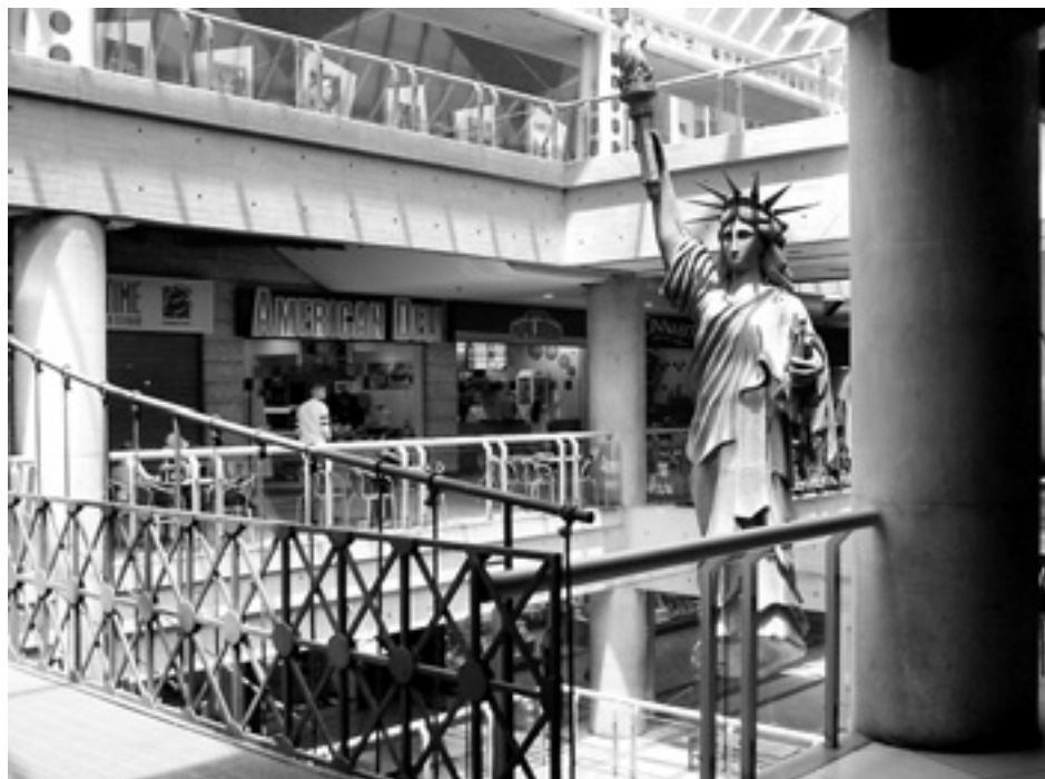
... och det botoxinjicerat glättiga.

”Ett centrum för oljekulturen, som lika gärna hade kunnat vara huvudstad i staten Texas. Caracas tuggar tuggummi och älskar syntetiska produkter och skräpmat. Man går aldrig, förflyttar sig bara i bil, och avgaserna har förpestat dalens förr så rena luft. I Caracas är det svårt att