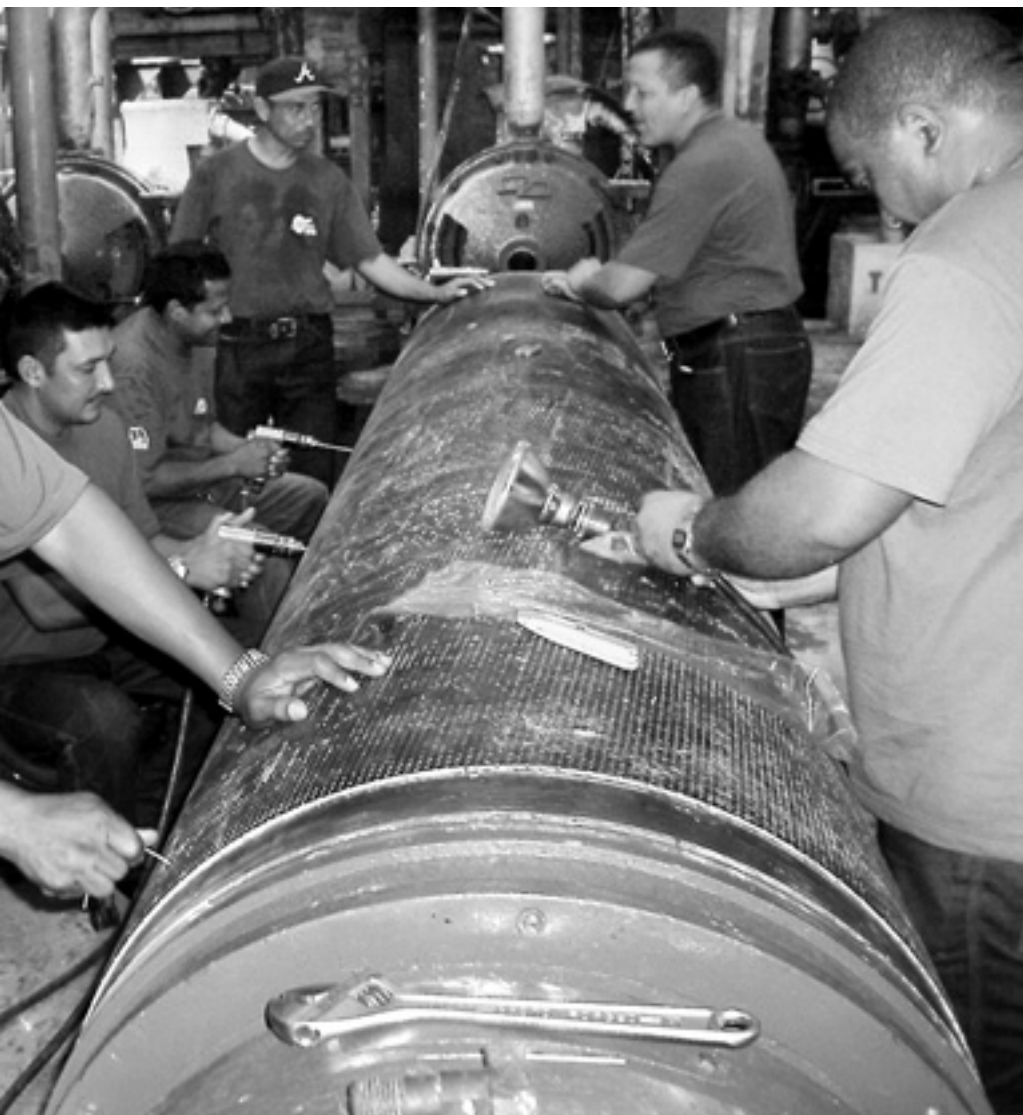
sig till lockouten mot regeringen 2002, gick arbetarna emot. Nu har de själva tagit över fabriken.