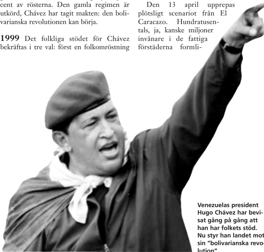
Venezuelas president Hugo Chávez har bevisat gång på gång att han har folkets stöd. Nu styr han landet mot sin "bolivarianska revolution".

Den 13 april upprepas plötsligt scenariot från El Caracazo. Hundratusentals, ja, kanske miljoner invånare i de fattiga förstädena formli-