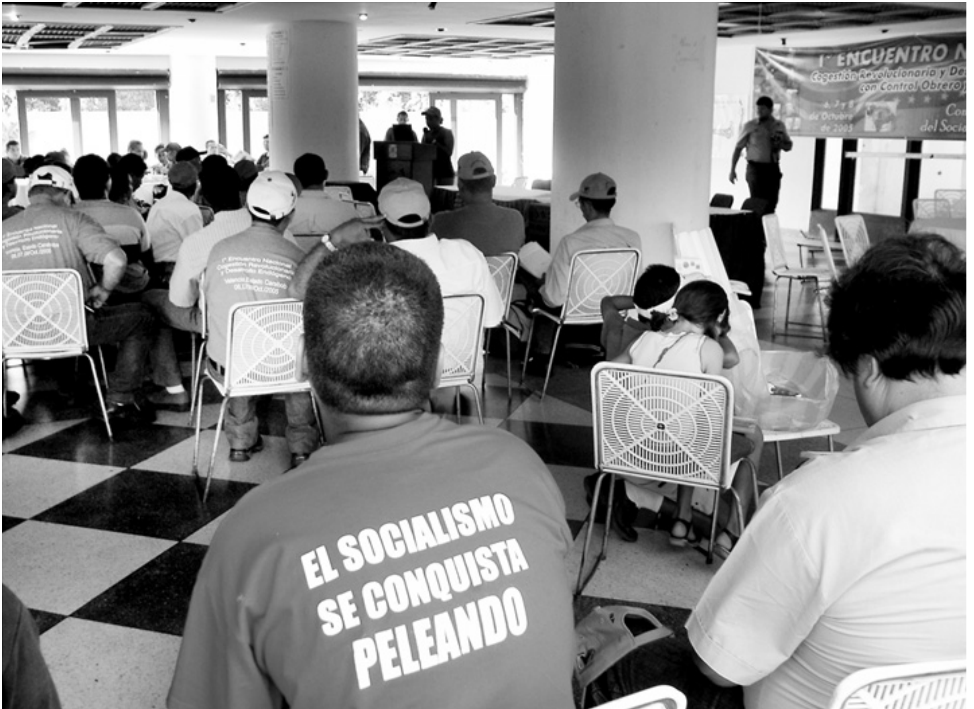
"Socialismen erövrar genom kamp", står det på tröjan hos en deltagare vid Nationella arbetarkonferensen för företag med arbetarmedverkan. Men Venezuelas regering satsar hellre på att det traditionella gradvis konkurreras ut av deltagardemokrati, än på direkt konfrontation.