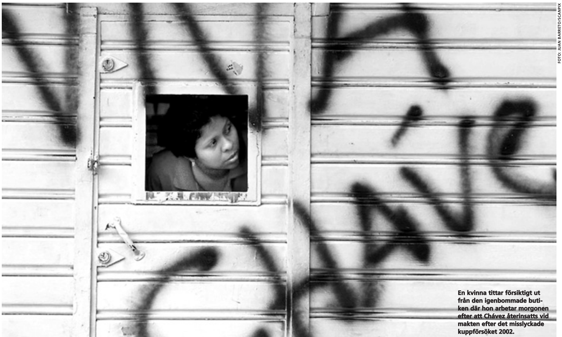
En kvinna tittar försiktigt ut från den igenbommade butiken där hon arbetar morgonen efter att Chávez återinsatts vid makten efter det misslyckade kuppförsöket 2002.

VID DEN MILITÄRKUPP mot Chávez som sattes i verket den 11 april 2002 rapporterade tevekanalerna oavbrutet från den enorma oppo- ►