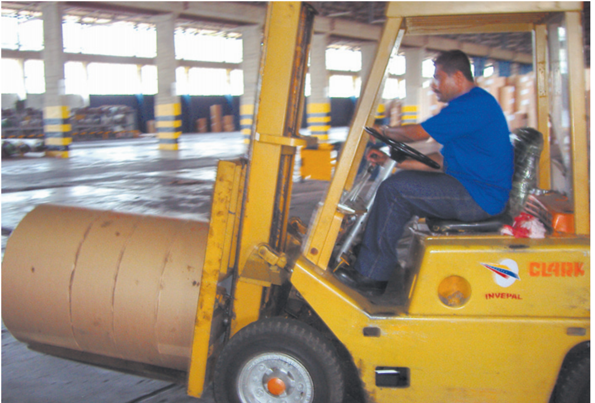
På Invepal får alla i arbetarkooperativet fortbildning för att bryta uppdelningen mellan teoretiskt och praktiskt. arbete.

dem från en dag till en annan. Det är ett arbete som pågår, säger hon utan att förklara svårigheterna närmare.