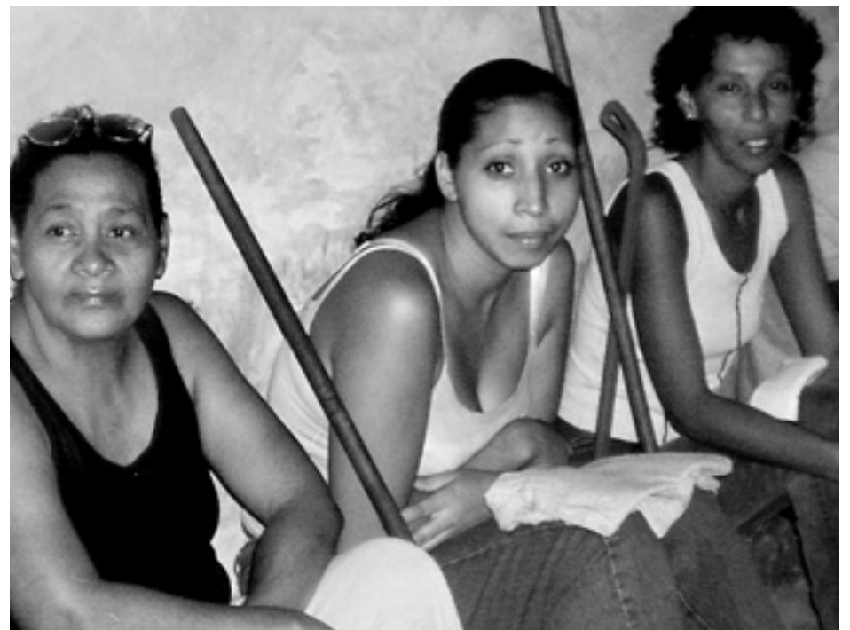
Ett 60 personers-kooperativ städar gator på kvällarna, utan annan utrustning än borstar.

i företaget ska kunna ta ut löner som motsvarar vad en kvalificerad tekniker tidigare tjänade, och de vill inte klandra myndigheterna för att det tagit så lång tid: