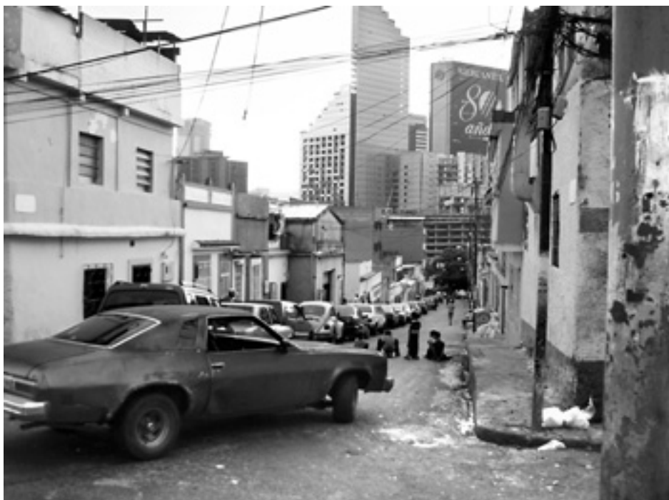
Venezuelas två ansikten, det rynkigt slitna...