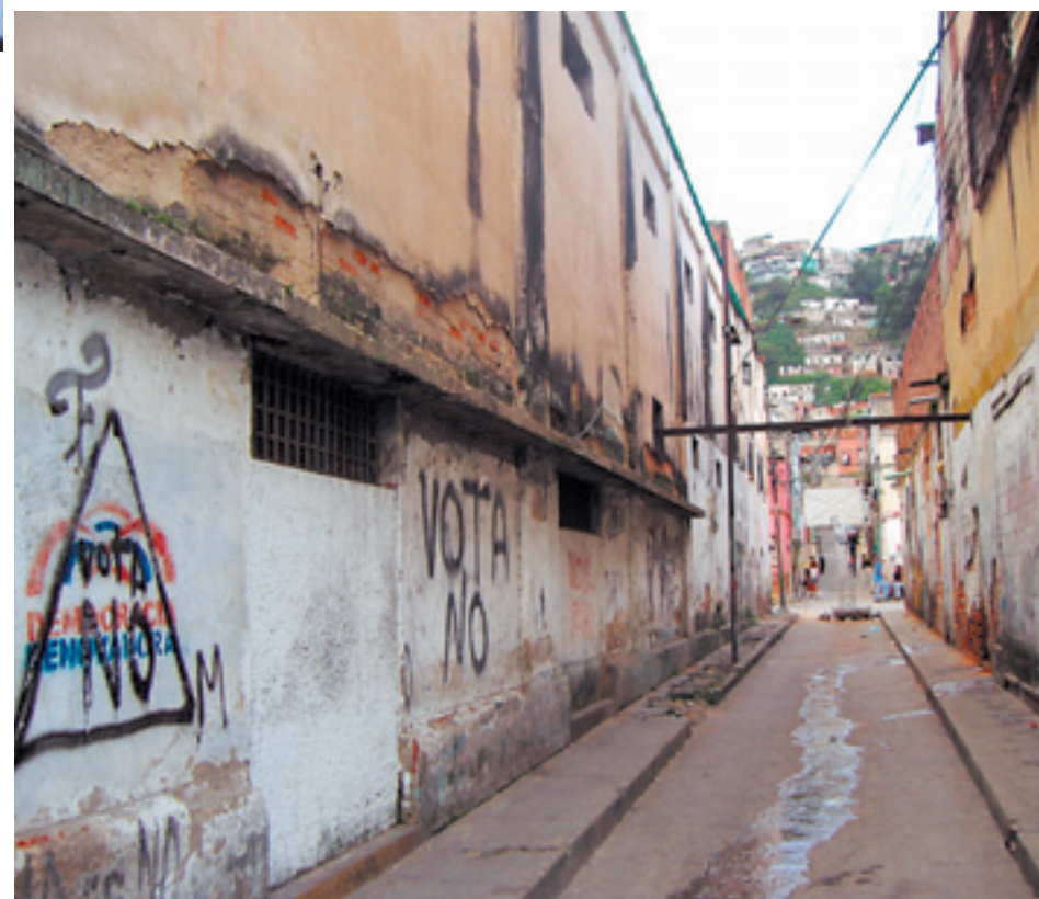
...men stödet för honom är fortsatt starkt, som i slagorden på husväggarna.

Vad de kommer att göra med denna nya insikt, och var det kommer att sluta, återstår ännu att se.