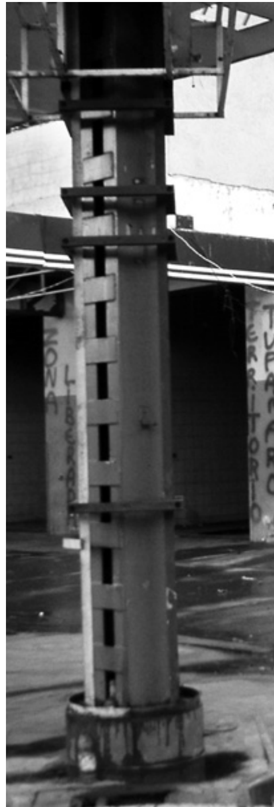
En ockuperad före detta bensinstation.