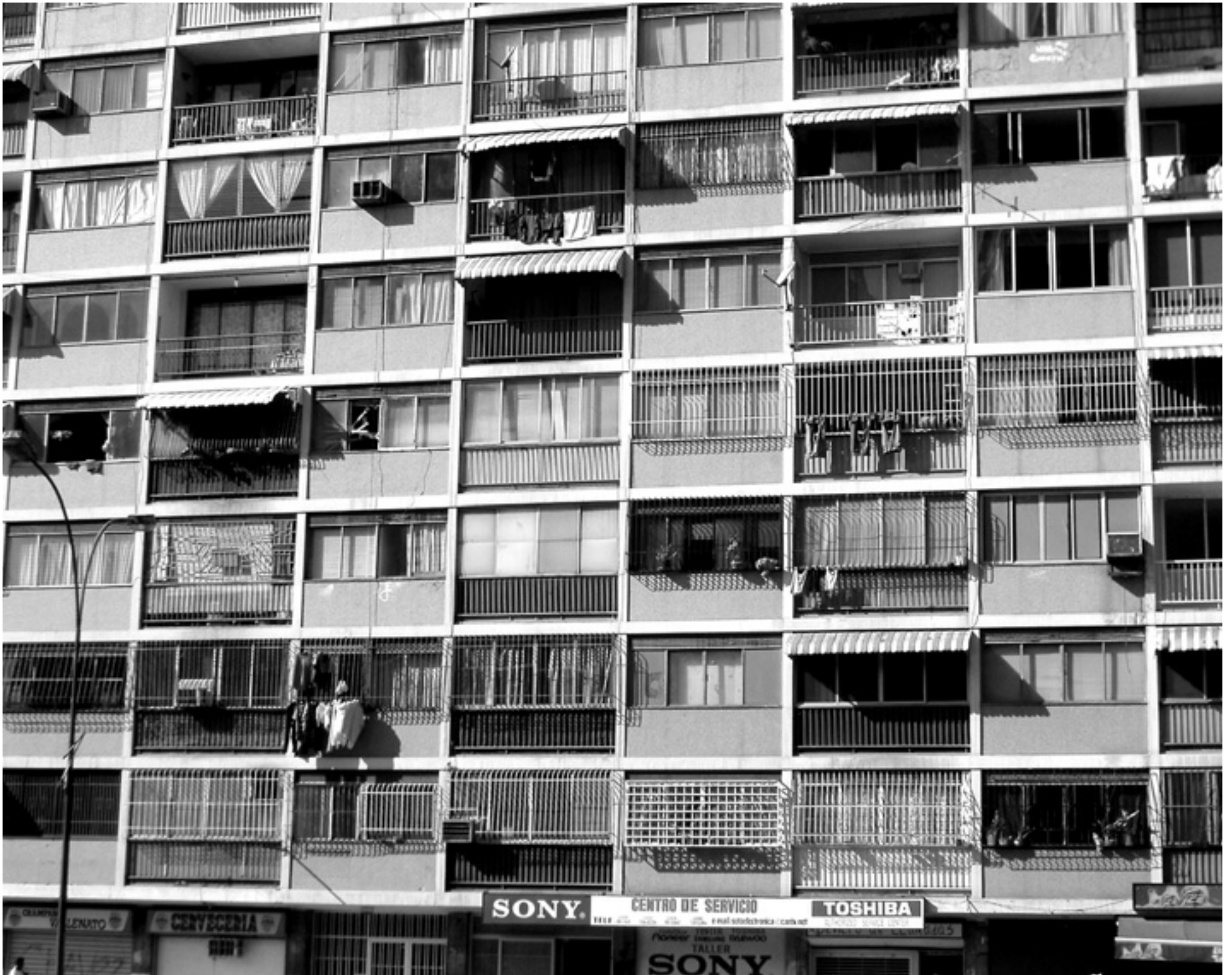
Mision Ribas utbildningsprogram innehåller en "sociopolitisk komponent" där eleverna ska göra någon form av projekt för att förbättra förhållandena i sitt bostadsområde.

ken utsträckning så sker för närvarande.