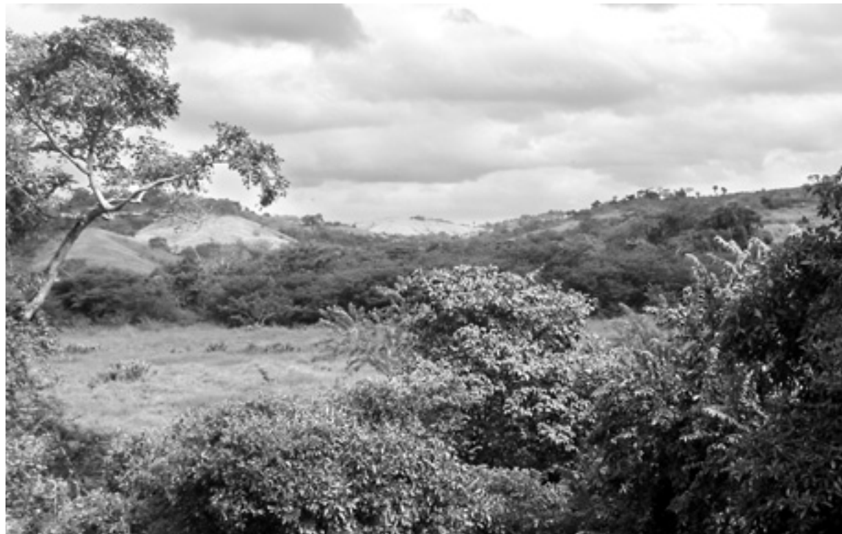
Mark i träda, i väntan på att åter brukas – kanske av nya ägare.