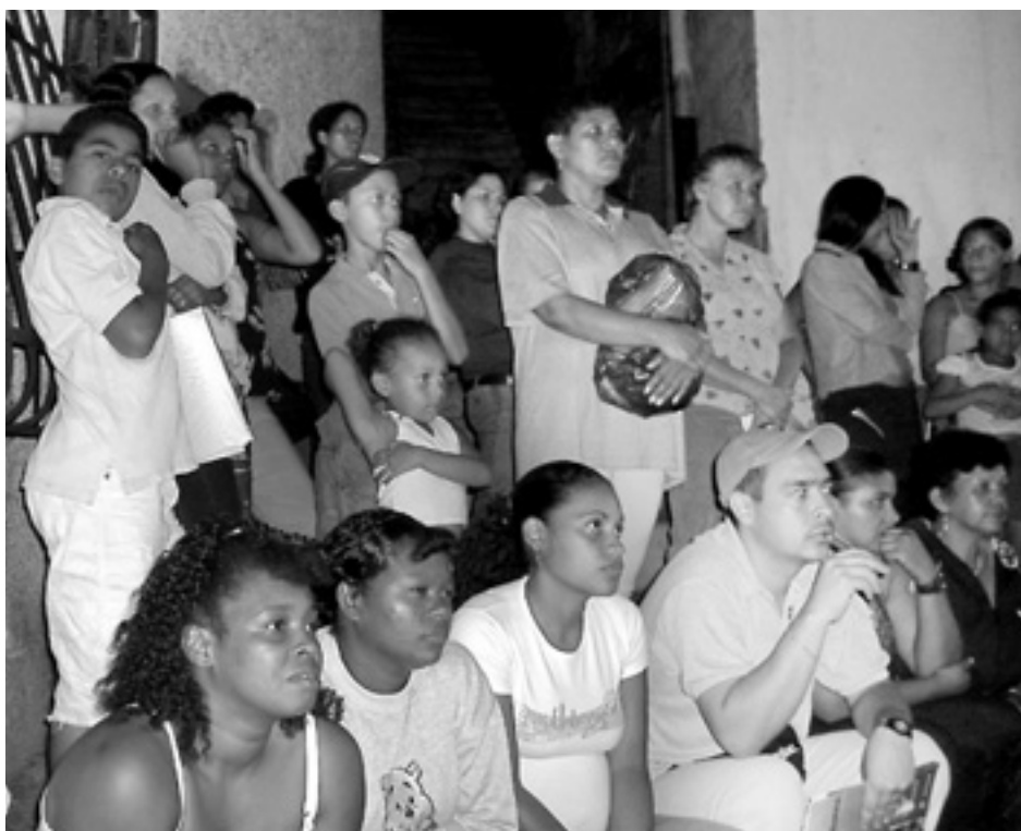
Engagerade deltagare i ett markkommittémöte där hus som hotas av lerskred diskuteras.

ersatt den chavistiska massorganisering som tidigare fanns i fattiga bostadsområden, de "bolivarianska cirkelarna" och de "valtaktiska stridsgrupperna", som i dag har tynat bort. Det finns i dag omkring 5 000 kommittéer, omfattande hundratusentals aktiva som representerar bostadsområden med över 5 miljoner invånare.