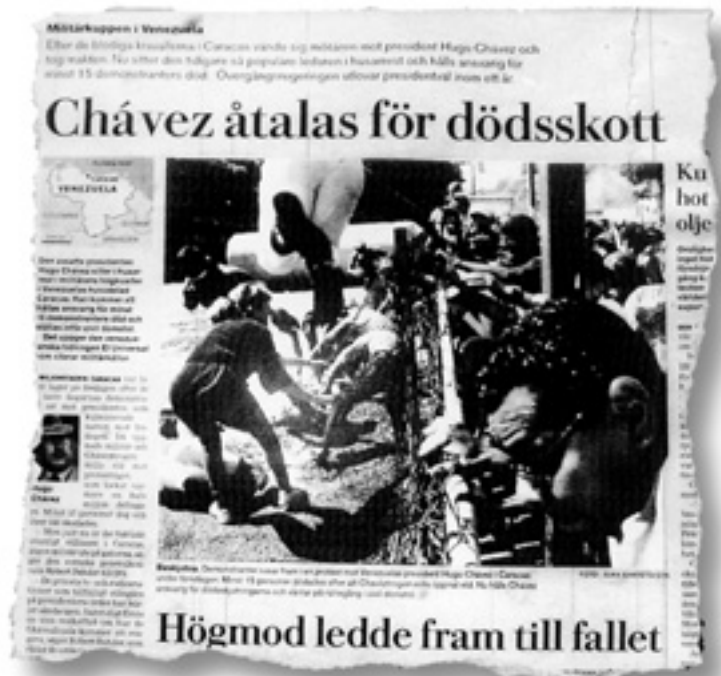
DN 13 april 2002.

I HUVUDESAK HAR CHÁVEZ , och de folkrörelser som stödjer honom, gått till motangrepp med andra vapen. Med sina omfattande oljeinkomster i ryggen har regeringen inte haft några finansiella problem att starta egna medier. Den bolivarianska revolutionen hål- ler sig med en egen dagstidning, Diario Vea .